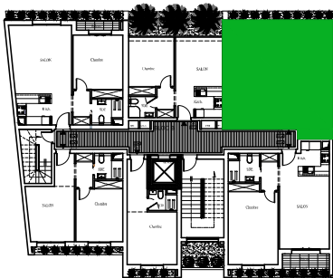
LOGEMENT TYPE Appartement N° B2-2

N.B: Les surfaces indiquées sont à titre indicatif ,les surfaces definitives seront déterminées par l'office de la topographie et de la cartographie